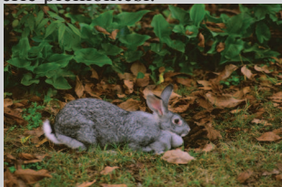
Proprietà Assessorato Agricoltura Regione Piemonte. Foto F. Murgia

Molto diffusa fino agli anni '50 poi quasi scomparsa. L'impegno dell'Università di Torino l'ha fatta rinascere ed è proprio l'Università che detiene un nucleo puro composto da 10 maschi e 70 femmine non consanguinei. Non può essere allevato in gabbia ma ha bisogno di un piccolo prato recintato. Si segnala l'ottima resa: le ossa sono sottili e la massa muscolare è superiore alle altre razze. La carne è fine, tenera, sapida, particolarmente bianca e mai stopposa. Una volta, il coniglio grigio ai peperoni (altro prodotto di punta di Carmagnola) non mancava mai nei menu delle osterie piemontesi.