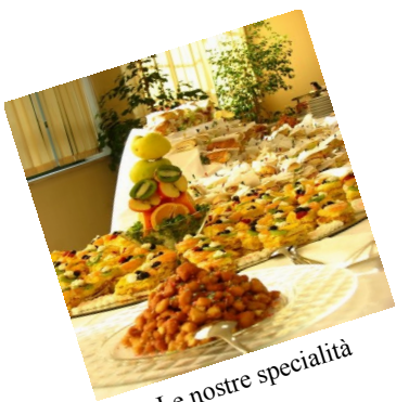
Le nostre specialità