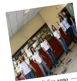
Saggio di fine anno