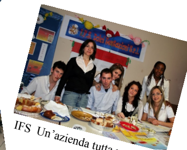
IFS Un'azienda tutta nostra