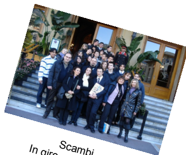
Scambi In giro per il mondo